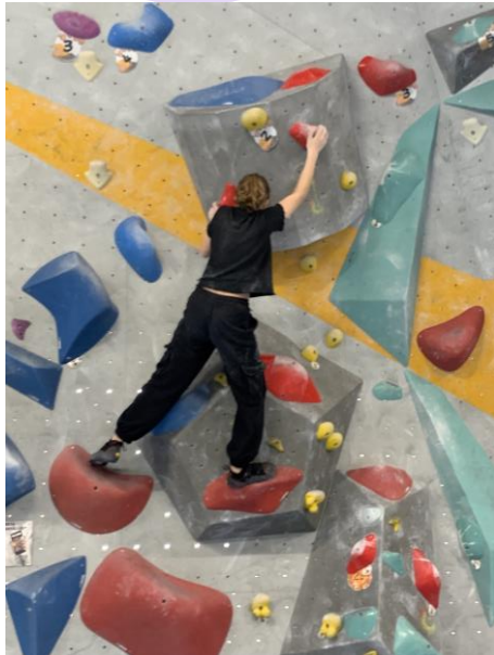
📷 Hoch hinaus beim Bouldern – Konzentration, Kraft und Vertrauen

Besonders beeindruckend war zu sehen, wie Kinder über sich hinauswuchsen: oben an der Wand, voll konzentriert, stolz auf das Erreichte. Andere starteten vorsichtig am Boden – und genau das war genauso richtig. Hier ging es nicht um Leistung, sondern um Mut, Vertrauen in den eigenen Körper und gegenseitige Unterstützung .